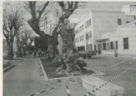
Gli alberi diventati un vero caso politico